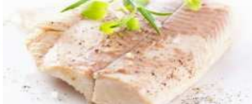
la terrine de saumon